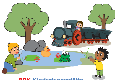
BRK Kindertagesstätte AM BAHNWEIHER